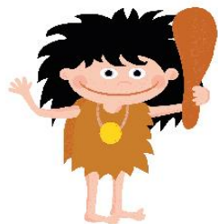
Ребенок в первобытное время

Учился у своих сородичей, как добывать пищу и что можно есть, а что является ядом для человека