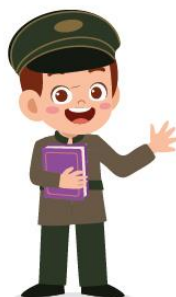
Ученик царской гимназии

Учился у своих сородичей, как добывать пищу и что можно есть, а что является ядом для человека